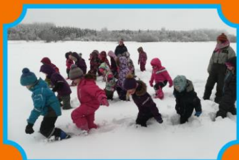
Kirnas hundi jälgi ajamas