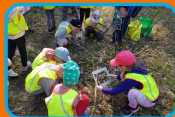
Ihastes kevadet otsimas