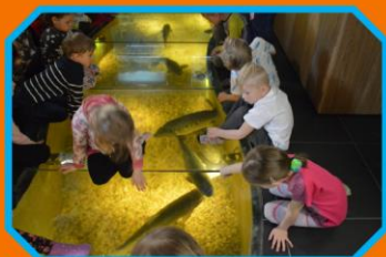
Mida kalad teeavad

Kõike mida nägime, kogesime ja tegime kogusime siia töövihikusse