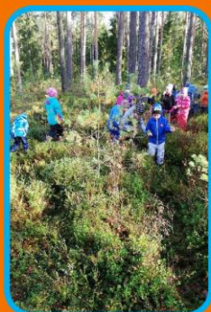
Laeva soos marju noppimas